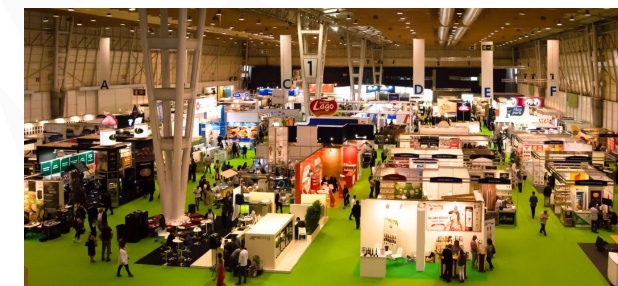
Alimentaria & Horexco Lisboa

Sólo cuando conoce sus derechos y opciones de actuación usted protegerá de forma efectiva sus productos, diseños o marcas.