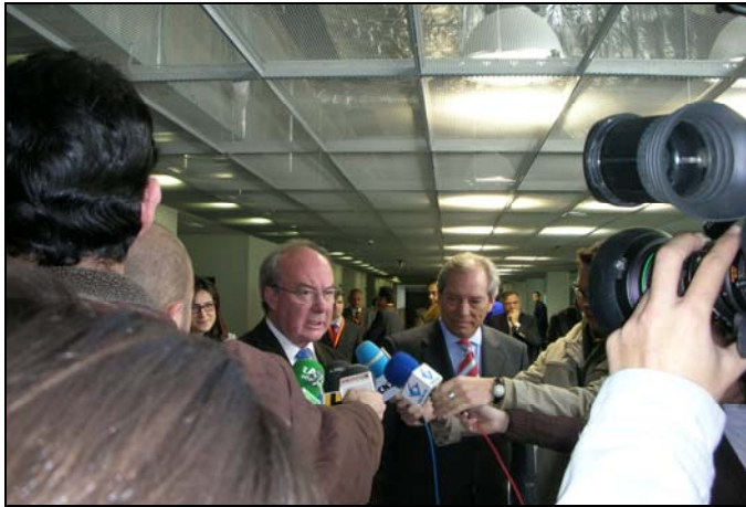
Manuel Pérez , alcalde de Albacete, atendiendo a los medios de comunicación.