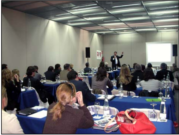
Interior de la Sala de Ponencias.