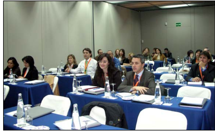
Interior de la Sala de Ponencias en el Palacio de Congresos de Albacete.