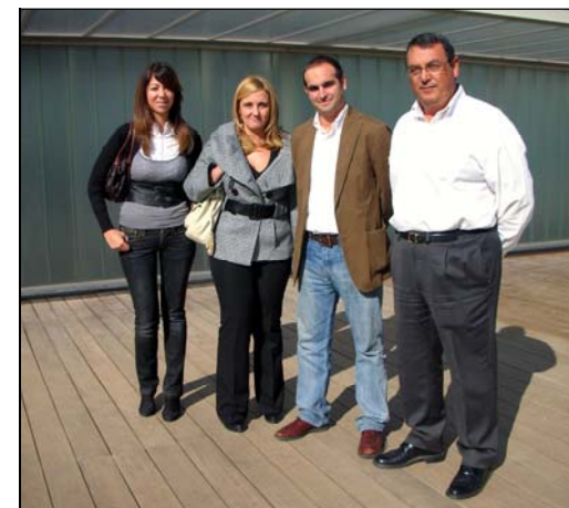
Asistentes a la jornada en representación de las instituciones feriales andaluzas.